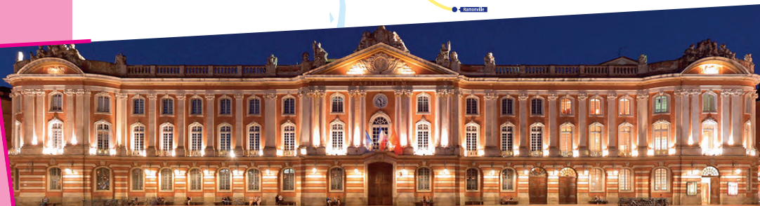
Mairie de Toulouse - Le Capitole